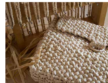
Centar rukotvorina Rogatec