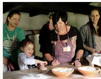
Muzej na otvorenom Rogatec